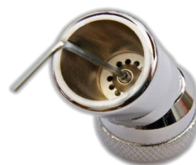
Einstellung erfolgt mit ei- nem Innensechskant- schlüssel