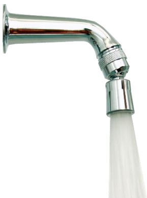
Duscharm mit Sportdusche Micro Schwenkkopf 1/2" IG